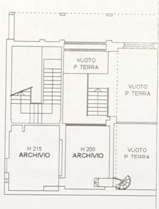
AMMEZZATO FRA P. TERRA E P. PRIMO (P.LLA 63/516)